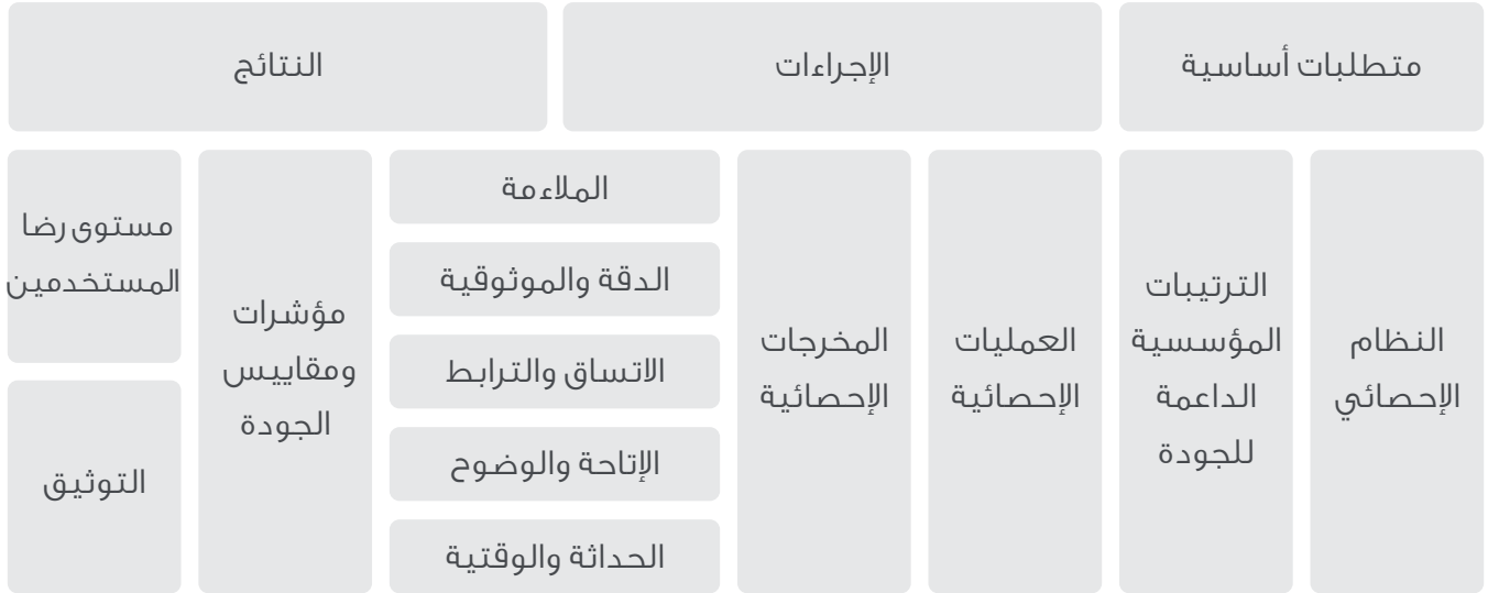
شكل (2) : عناصر تقييم الجودة الإحصائية للنظام الإحصائي لإمارة أبوظبي

ينبغي تقييم الجودة للمنتجات الإحصائية على نحو منتظم ومستمر، بحيث يغطي التقييم محاور الجودة التي تم ذكرها في هذا الإطار، وينبغي أن يتم إعداد آلية واضحة لتقييم كافة مكونات العمليات الإحصائية والمخرجات بمختلف مراحلها. تتوافق عملية تقييم الجودة وتطويرها مع نموذج الجودة الإحصائية للنظام الإحصائي لإمارة أبوظبي كما تتوافق عملية التقييم والتطوير للجودة الإحصائية مع النموذج الأوروبي لإدارة الجودة وهذا النموذج معتمد من جائزة أبوظبي للأداء الحكومي المتميز والذي يطبق على كافة الجهات الحكومية في الإمارة. الشكل التالي يوضح عناصر تقييم الجودة الإحصائية للنظام الإحصائي لإمارة أبوظبي: